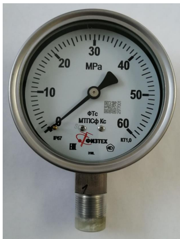
Рисунок 2 – Общий вид приборов моделей МТПСф, МВТПСф; ВТПСф