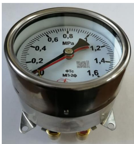
Рисунок 3 – Общий вид приборов модели МП-2ф