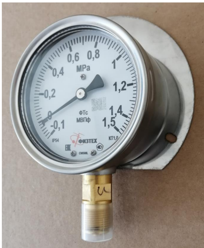
Рисунок 1 – Общий вид приборов моделей МПф, МВПф, ВПф

Общий вид приборов приведен на рисунках 1 - 3.