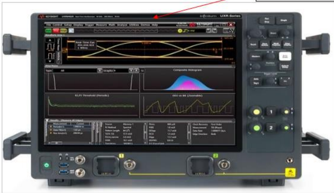
Рисунок 2 Общий вид осциллографов UXR0402A, UXR0502A, UXR0592A