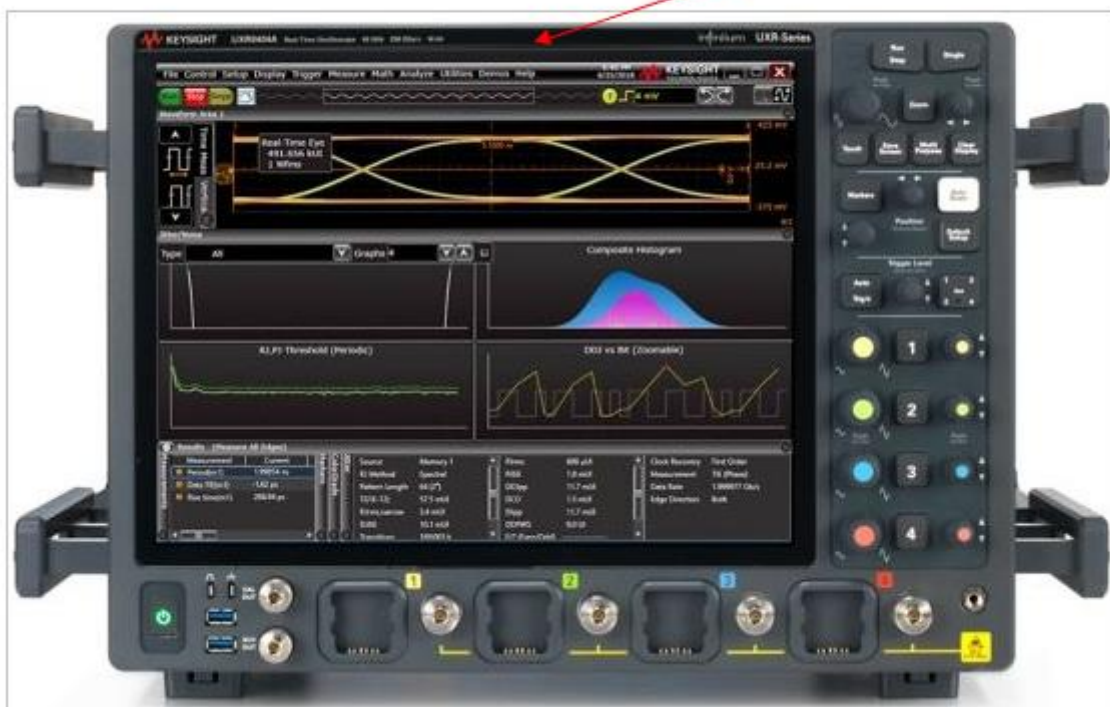
Рисунок 3 Общий вид осциллографов UXR0404A, UXR0504A, UXR0594A