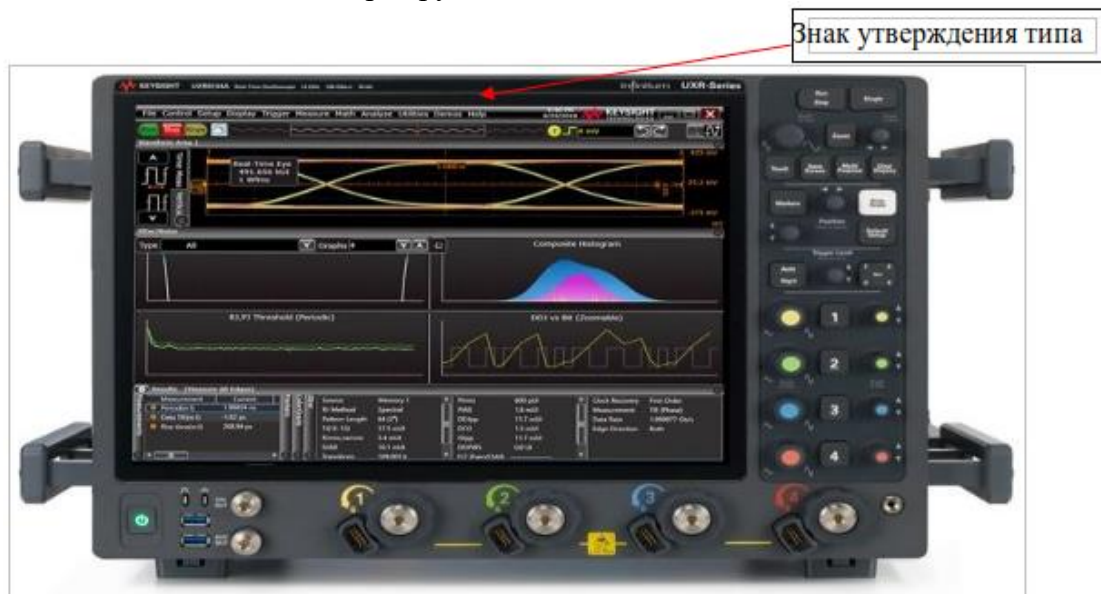
Рисунок 1 Общий вид осциллографов UXR0104A, UXR0134A, UXR0164A, UXR0204A, UXR0254A, UXR0334A

Примечание – Метрологические характеристики осциллографов серии UXR в режиме анализа спектра, а также характеристики пробников, адаптеров и преобразователей в настоящем описании типа не нормируются.