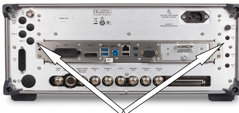
Места пломбирования от несанкционированного доступа