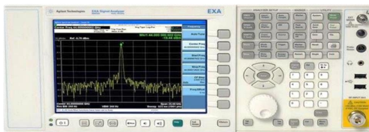
Рисунок 3. Общий вид передней панели приемников измерительных N9038A, N9038B

Общий вид передней панели приемников измерительных N9038A, N9038B представлен на рисунке 3. Общий вид задней панели приемников измерительных N9038A, N9038B представлен на рисунке 4.