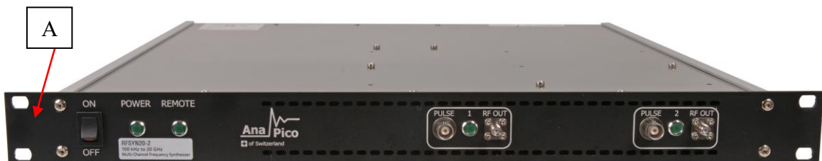
Рисунок 4 – Общий вид модификации RFSYN20-2 и место нанесения знака утверждения типа (А)