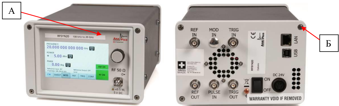
а) вид спереди