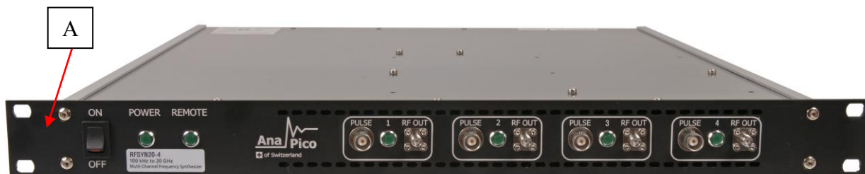
Рисунок 6 – Общий вид модификации RFSYN20-4 и место нанесения знака утверждения типа (А)