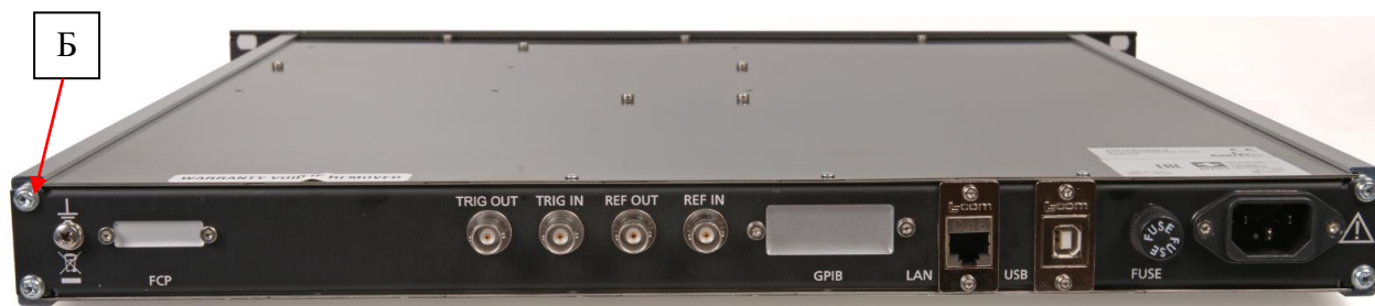
Рисунок 7 – Вид сзади модификаций RFSYN20-1, RFSYN20-2, RFSYN20-3, RFSYN20-4 и схема пломбировки от несанкционированного доступа (Б)