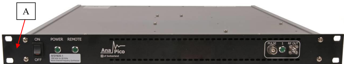
Рисунок 3 – Общий вид модификации RFSYN20-1 и место нанесения знака утверждения типа (А)