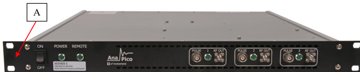
Рисунок 5 – Общий вид модификации RFSYN20-3 и место нанесения знака утверждения типа (А)