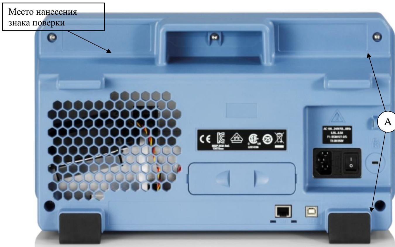
Рисунок 2 - Схема пломбировки от несанкционированного доступа (А) и нанесения знака поверки